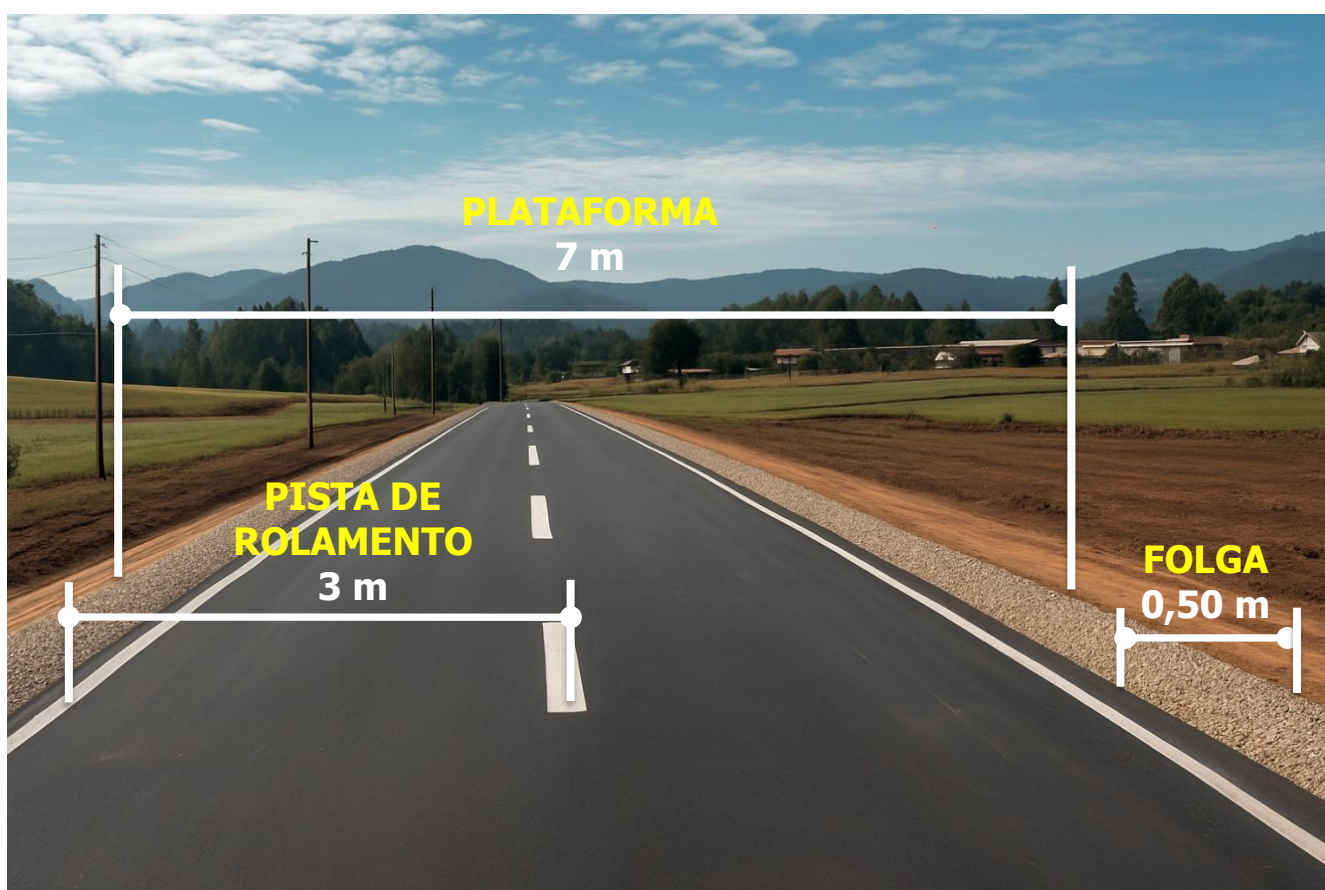
Figura 2. Seção transversal de referência