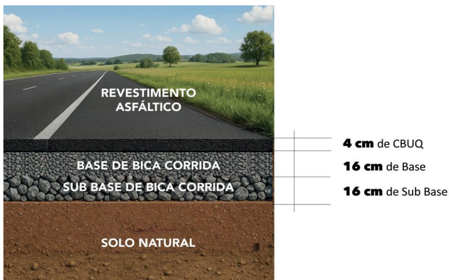
Figura 3. Seção típica de pavimento.

As peças técnicas do Programa Estrada Boa Rural foram padronizadas tomando como referência, um tráfego cujo VMD está em um intervalo de até 200 veículos/dia com até 10% de veículos de carga/comercial .